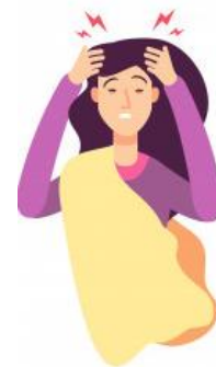
Sensación de falta de aire

Si durante un viaje o al retornar al país presentas síntomas similares, debes acudir de inmediato a un establecimiento de salud. No te auto mediques. También puedes llamar al 113.