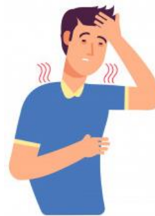
Malestar general Y respiración rápida