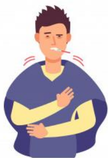
Fiebre Y Escalofríos