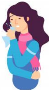
Tos y estornudos