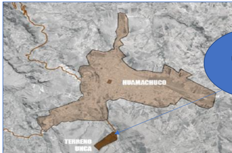
Imagen N° 001: Ubicación del estudio de pre inversión.

Región : La Libertad Provincia : Sánchez Carrión Distrito : Huamachuco Sector : Tantapusha II