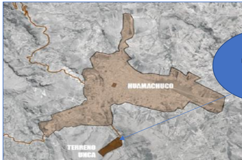
Imagen N° 001: Ubicación del estudio de pre inversión.

Región : La Libertad Provincia : Sánchez Carrión Distrito : Huamachuco Sector : Tantapusha II